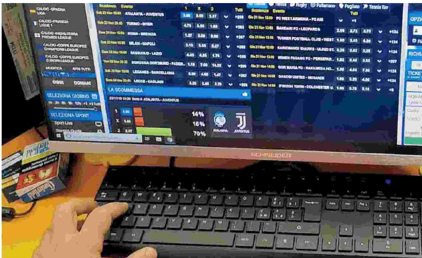
Scommesse e Coronavirus. È stato riscontrato un aumento delle giocate on line durante i giorni del lockdown