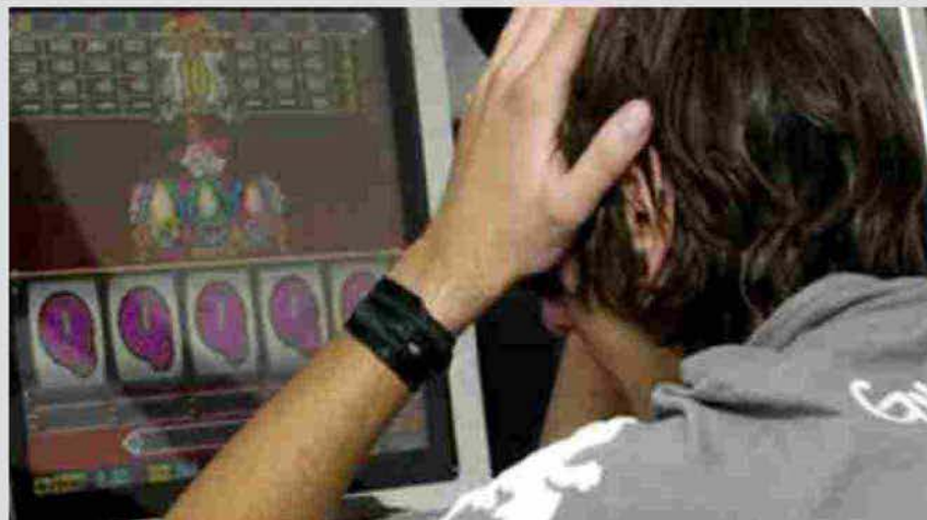
Dipendenza gioco d'azzardo